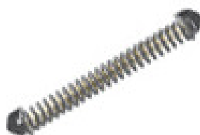
RESSORT AMOVIBLE POUR PORTE